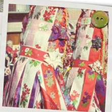
La Baïo - Sampyre